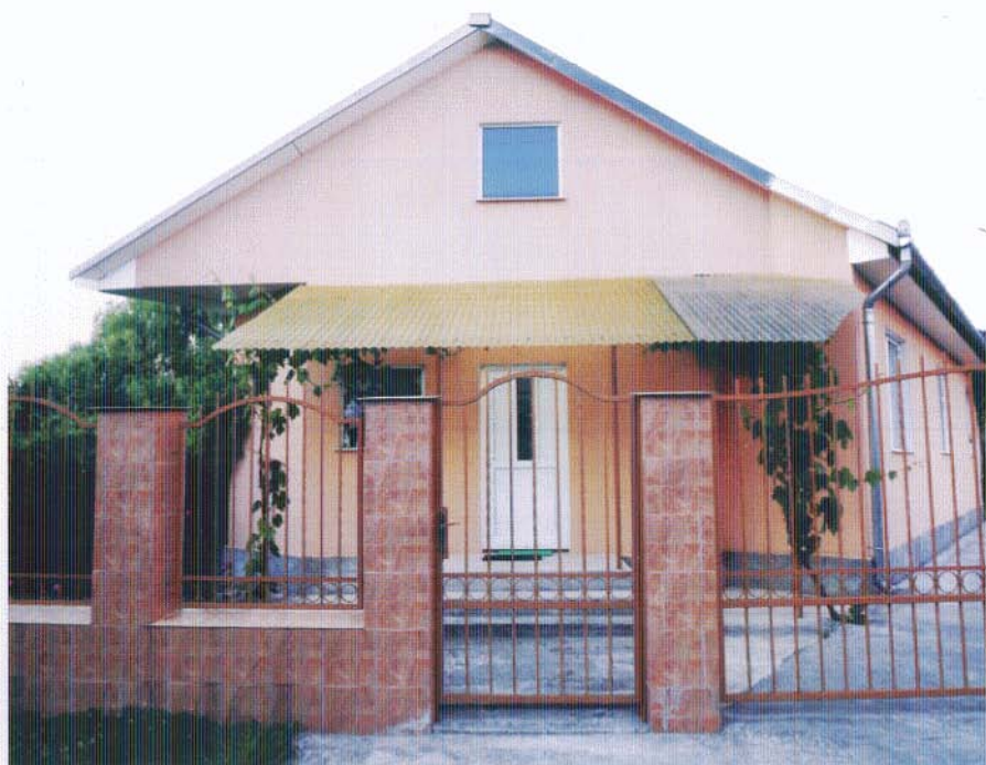
Casa de rugăciune „Sion”